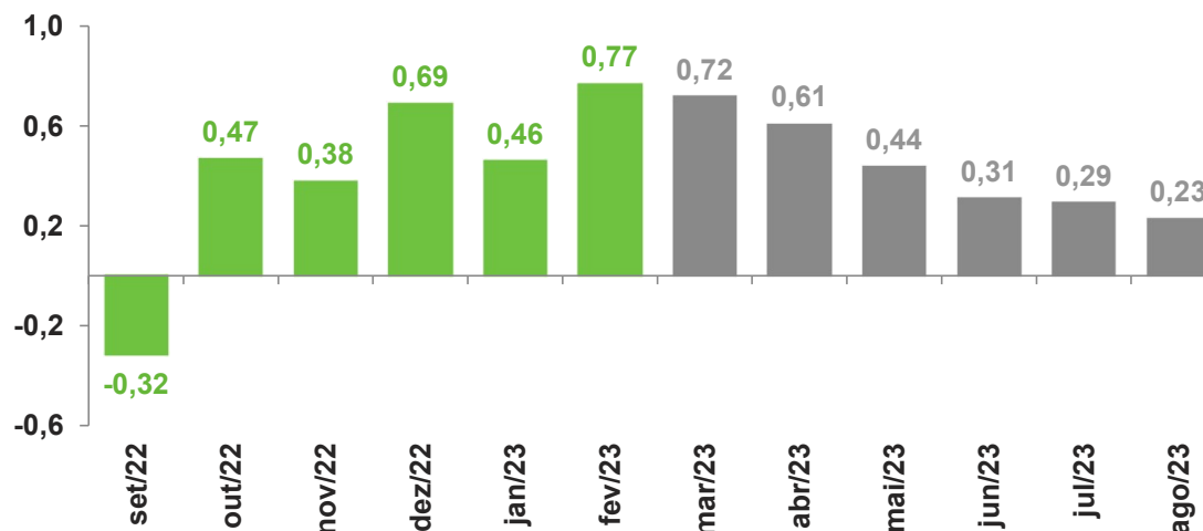
Variação % acumulada em 12 meses